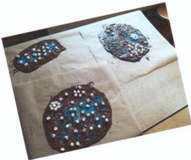
Autoren: Konstantin und Ole